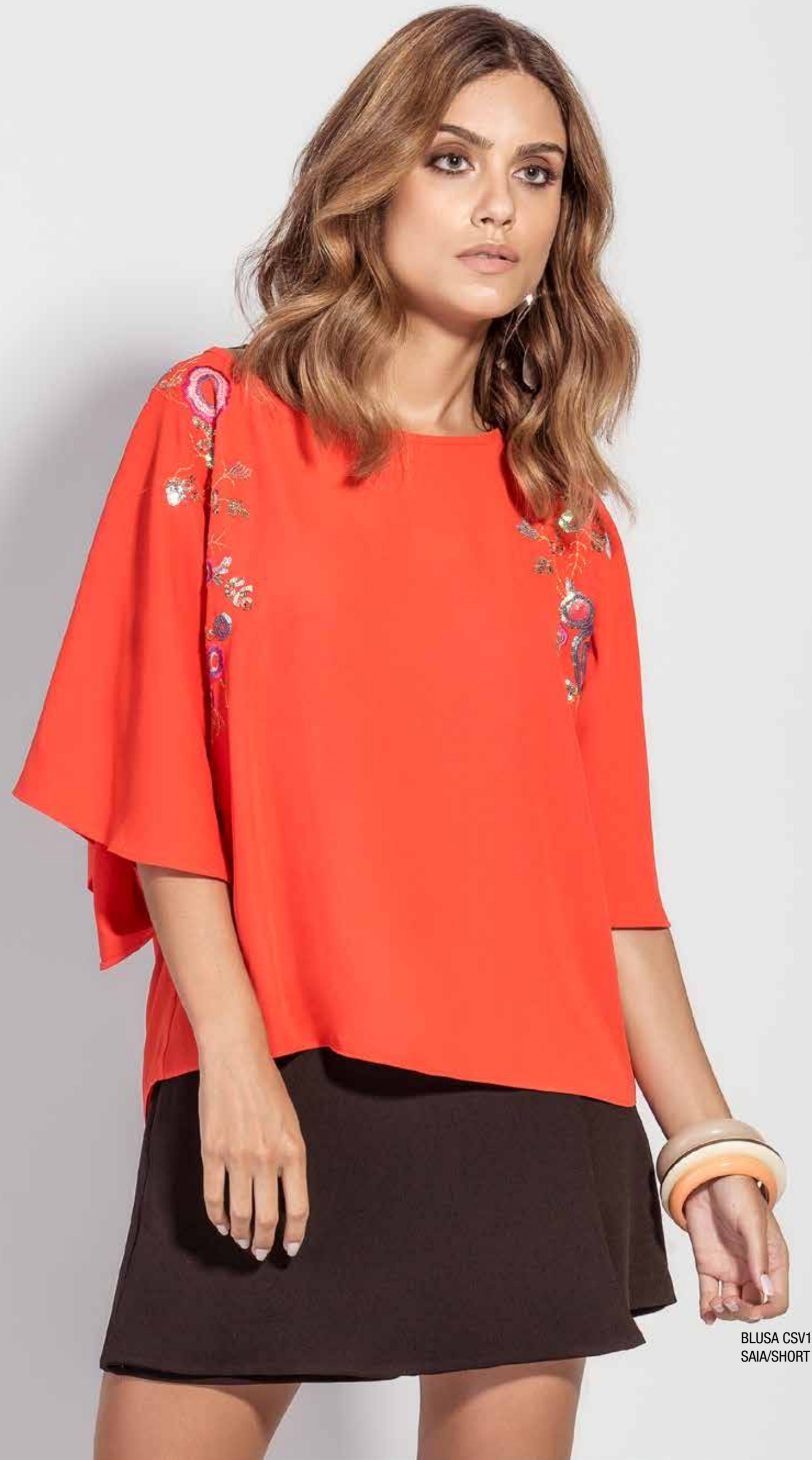
BLUSA CSV180216 SAIA/SHORT CSV180242