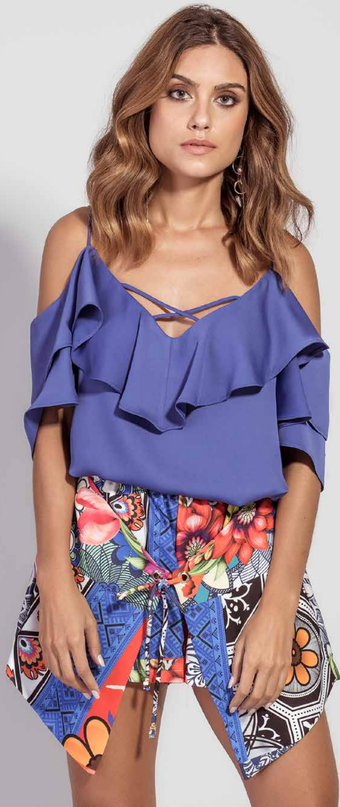
BLUSA CSV180273 SHORT CSV180321