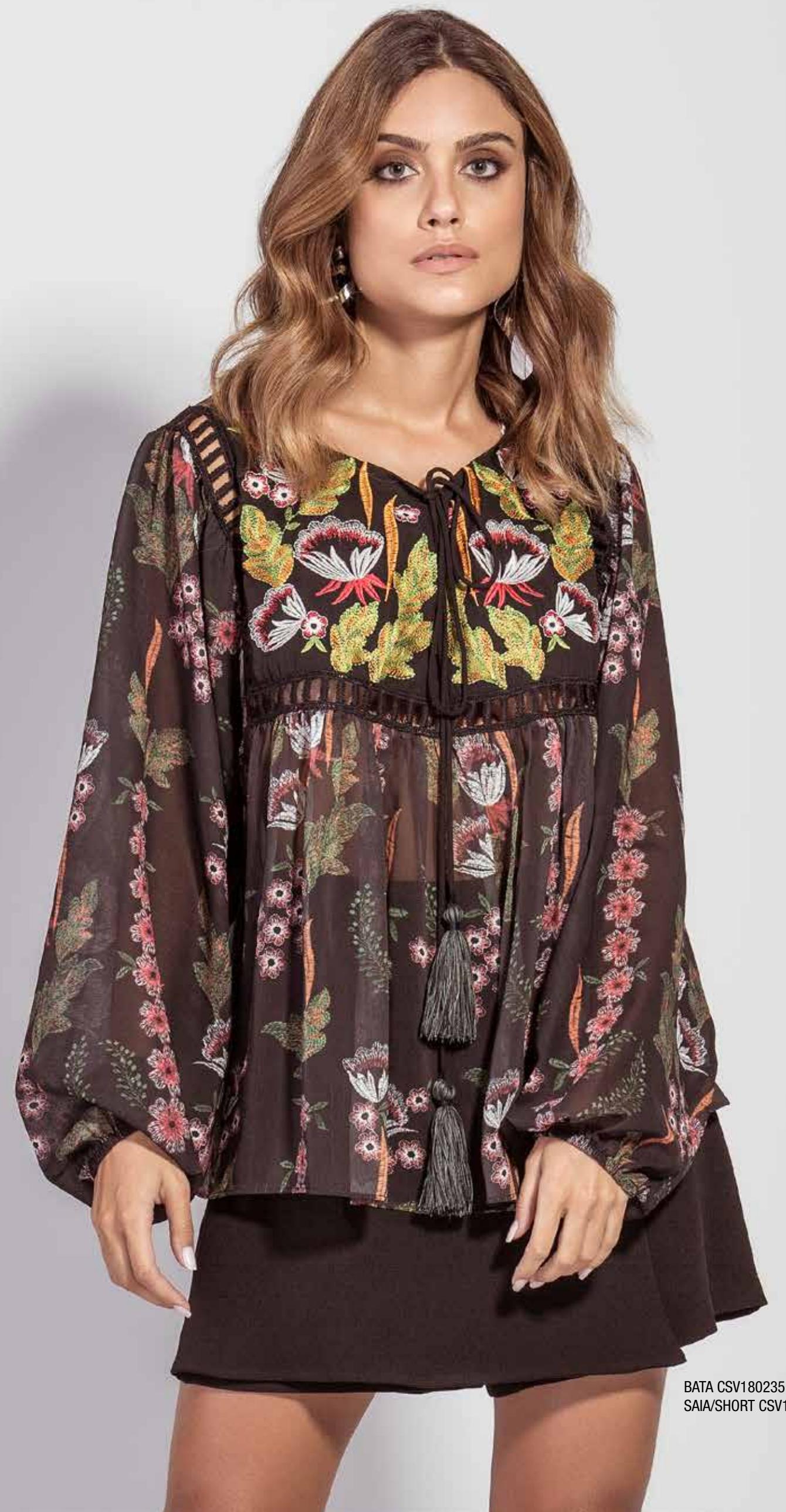
BATA CSV180235 SAIA/SHORT CSV180242