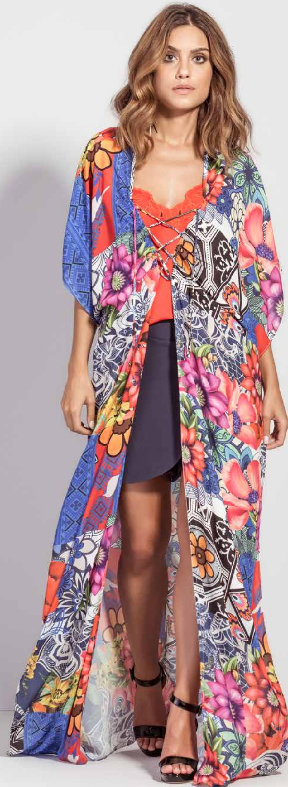
QUIMONO CSV180323 REGATA CSV180159