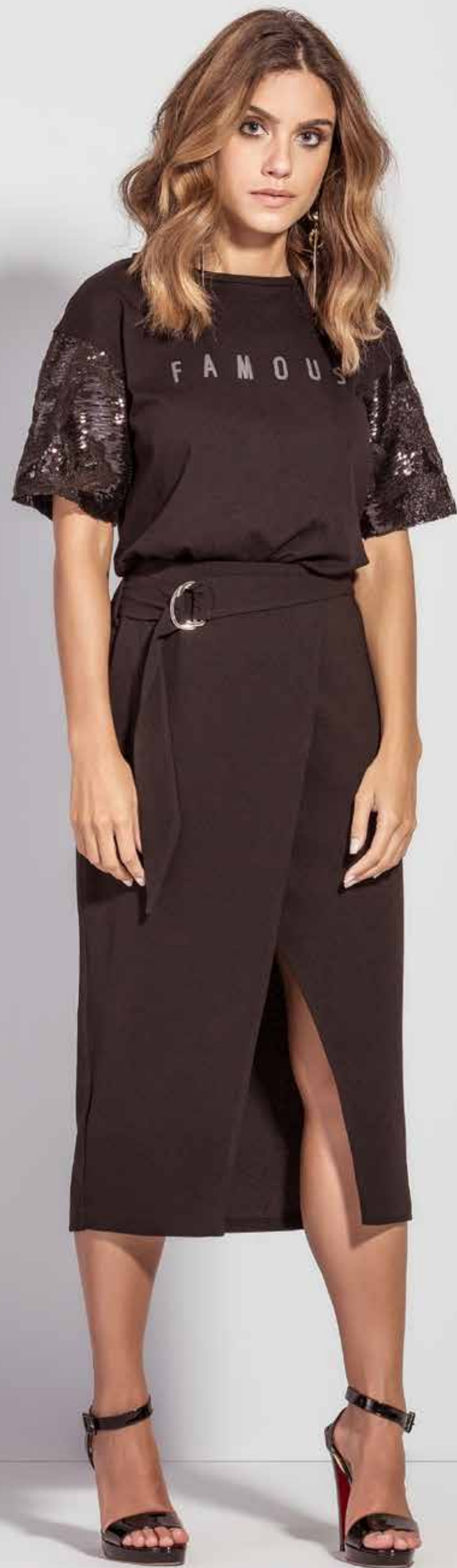
CAMISETA CSV180206 SAIA CSV180220