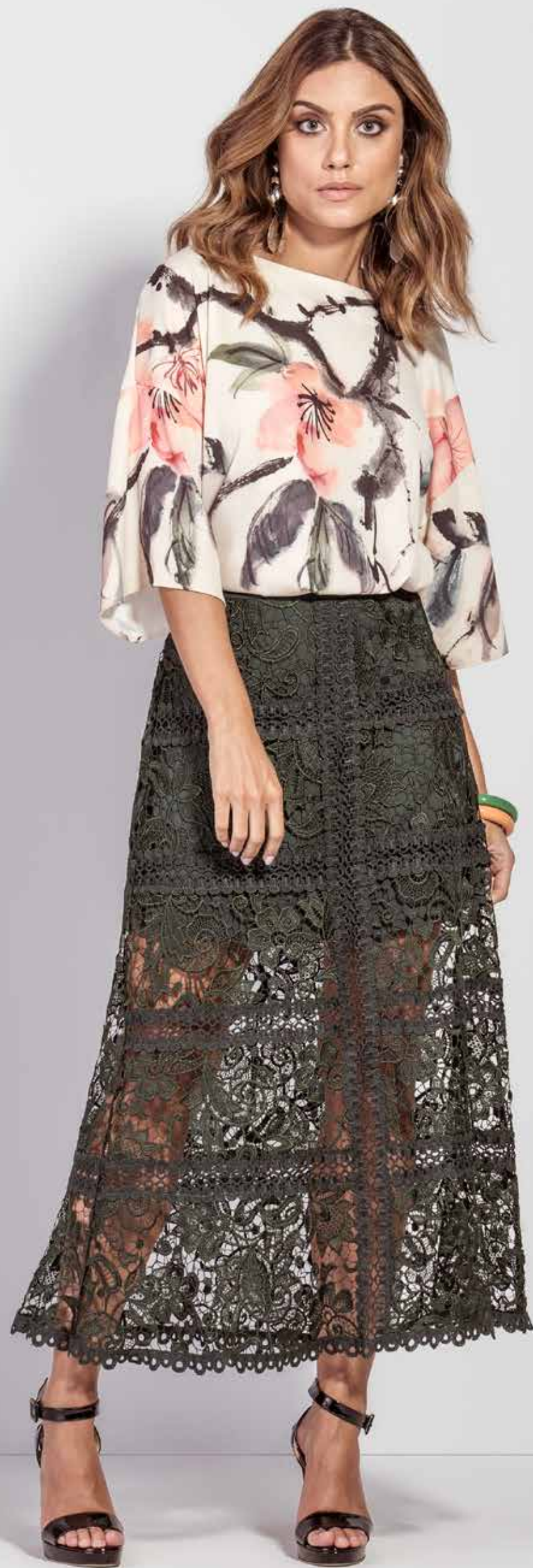
BLUSA CSV180217 SAIA CSV180245