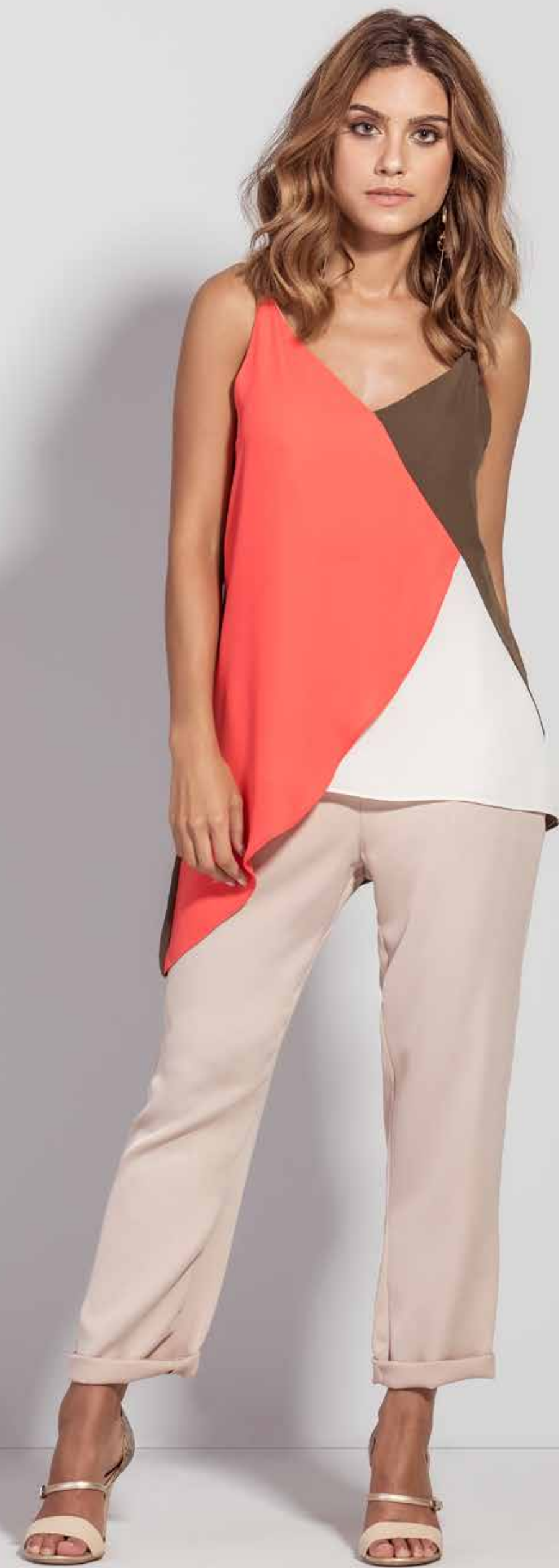
REGATA CSV180239 CALÇA CSV180232