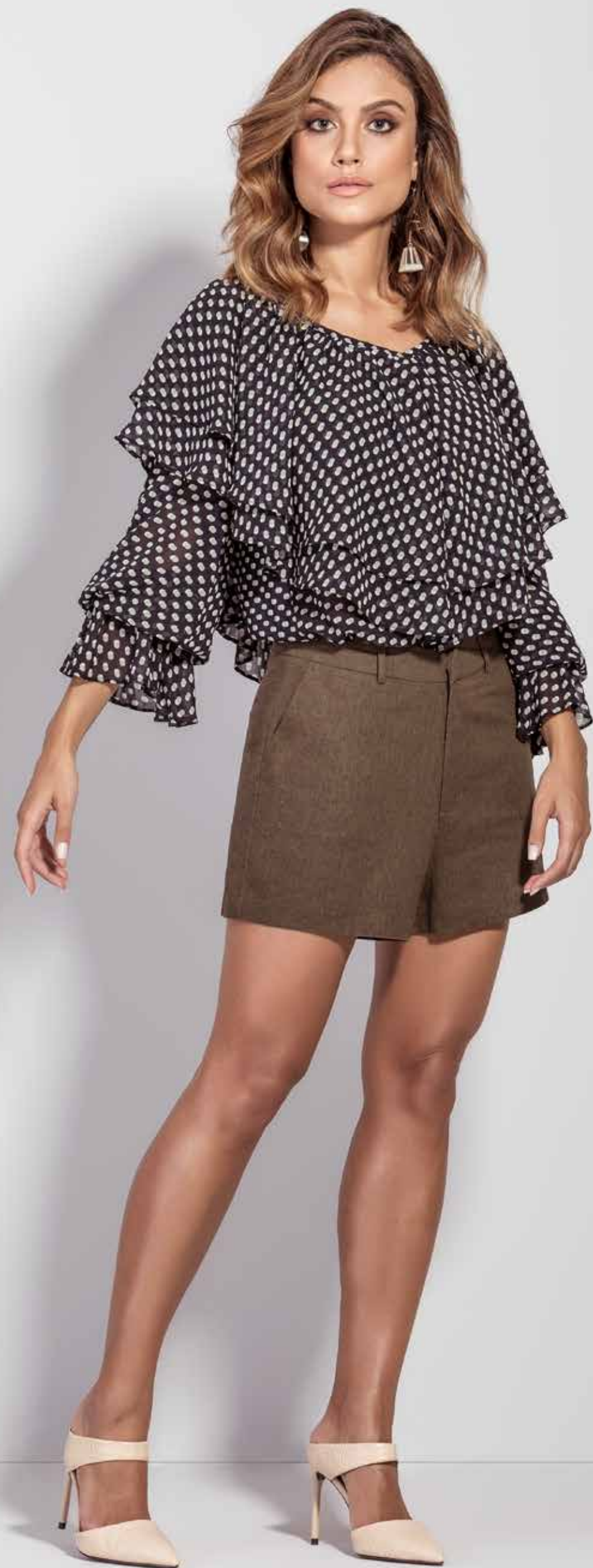
BLUSA CSV180203 SHORT CSV180253