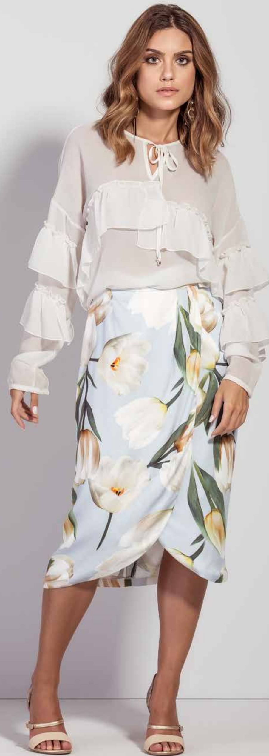
BLUSA CSV180208 SAIA CSV180262