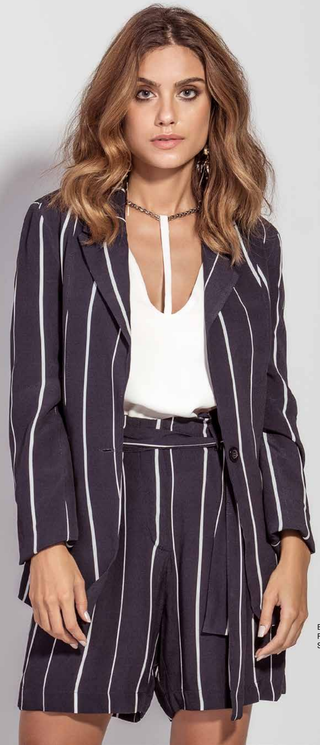
BLAZER CSV180193 REGATA CSV180213 SHORT CSV180141