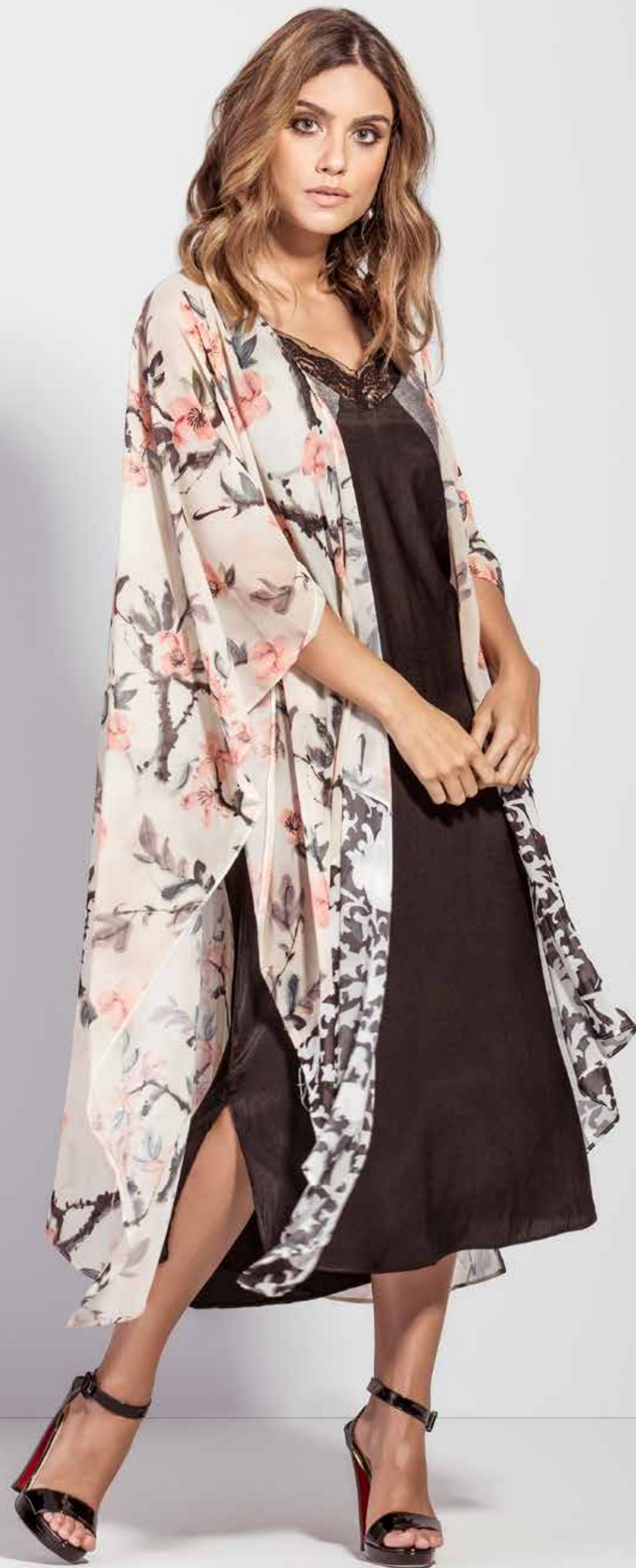
VESTIDO CSV180212 QUIMONO CSV180180