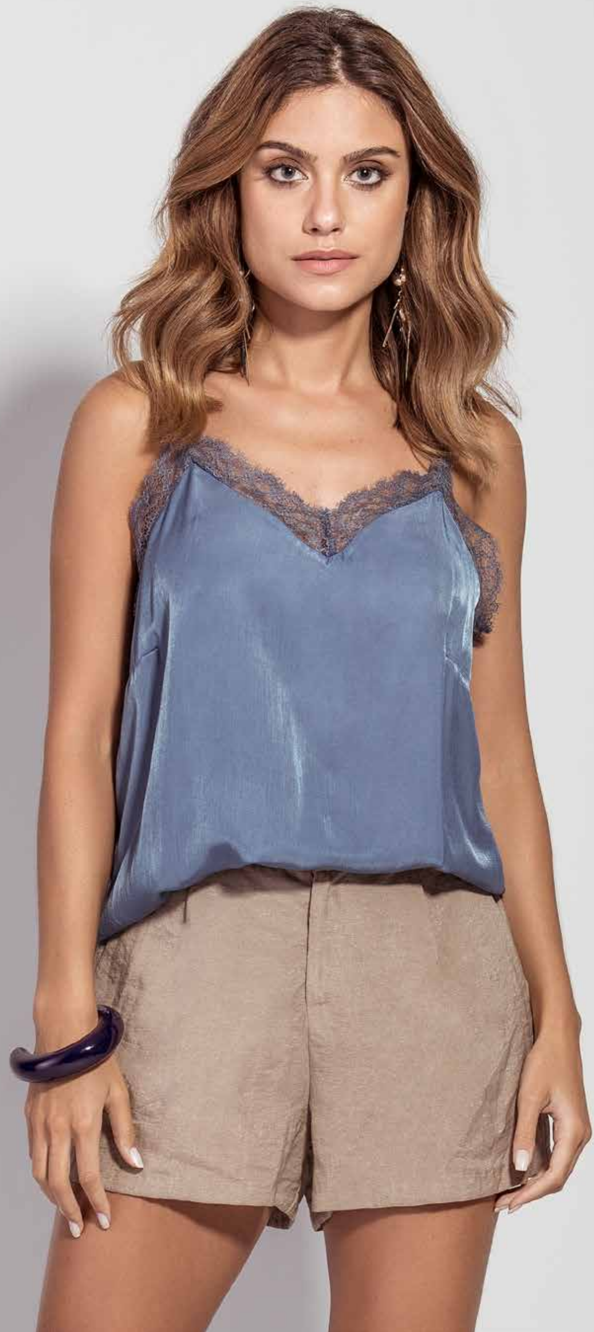
REGATA CSV180178 SHORT CSV180279