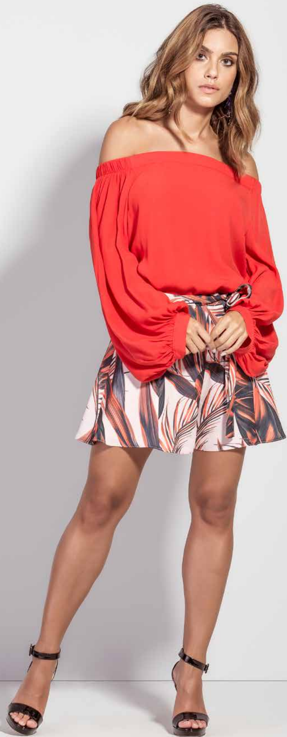
BATA CSV180314 SHORT CSV180197