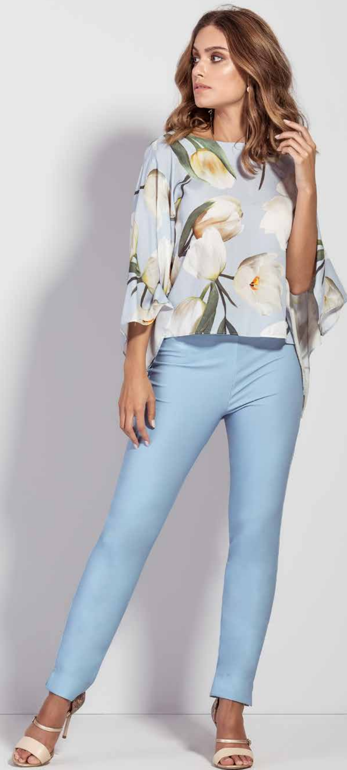
BLUSA CSV180263 CALÇA CSV180200