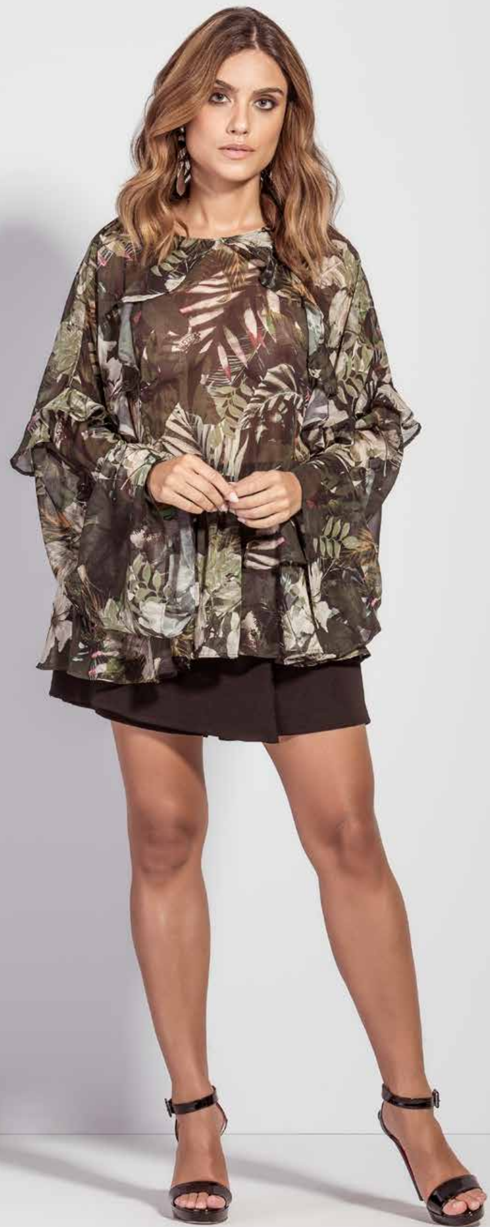
BLUSA CSV180250 SHORT CSV180242