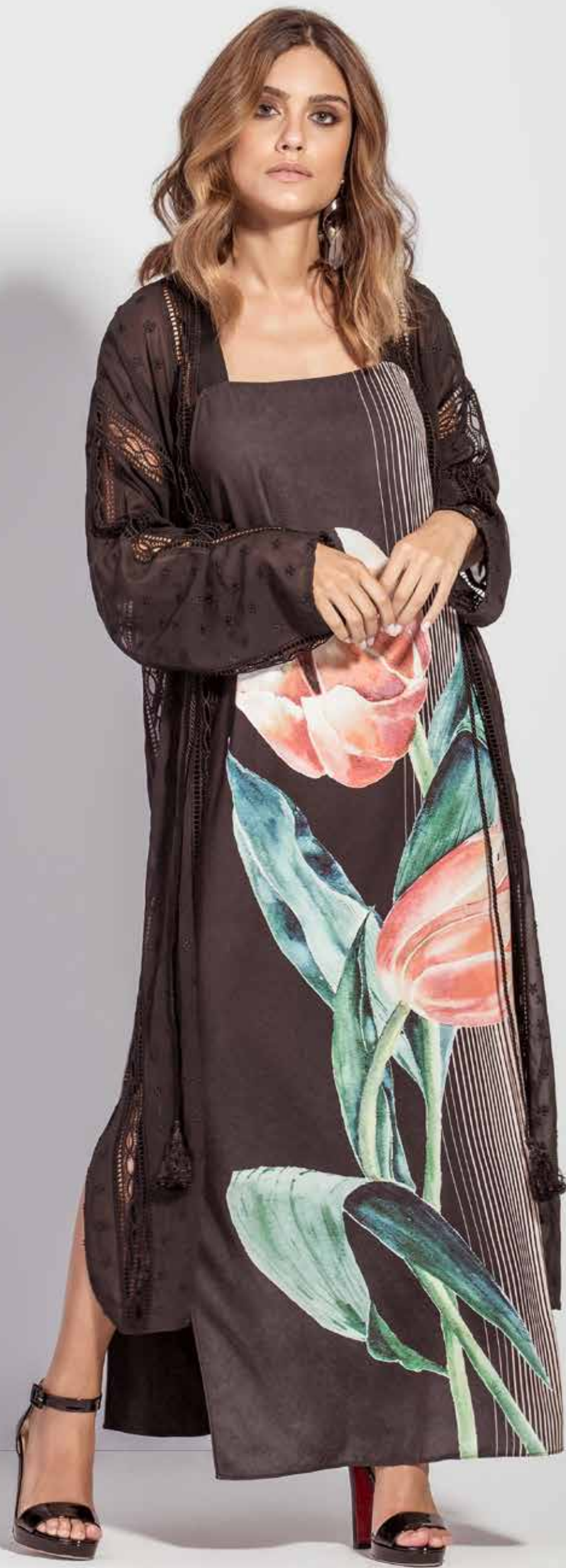
KIMONO CSV180241 VESTIDO CSV180187