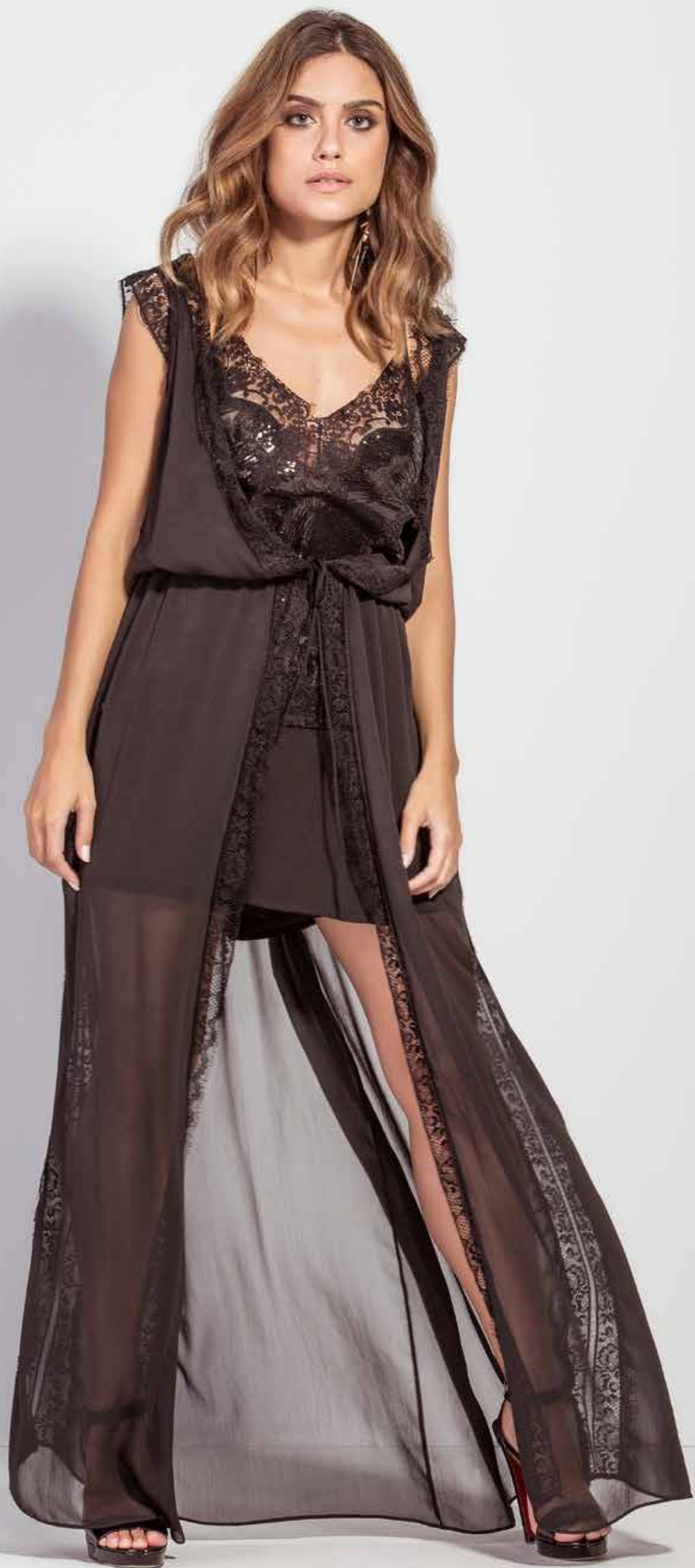
REGATA CSV180281 VESTIDO CSV180244