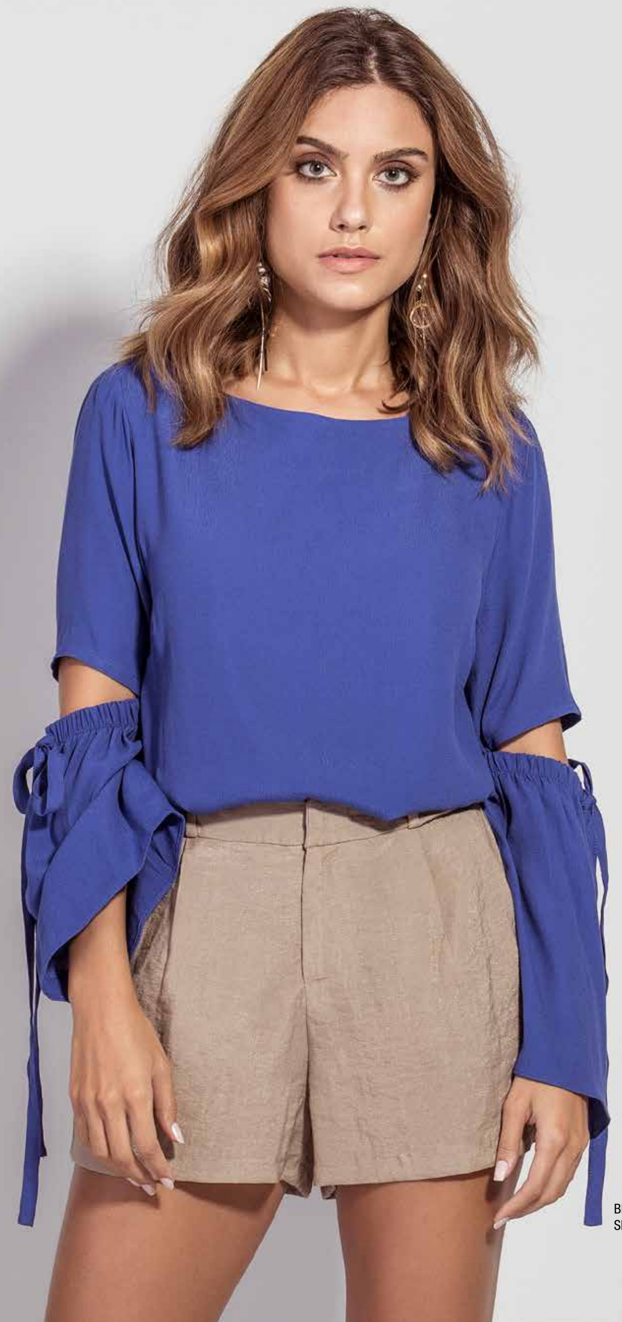
BLUSA CSV180315 SHORT CSV180279