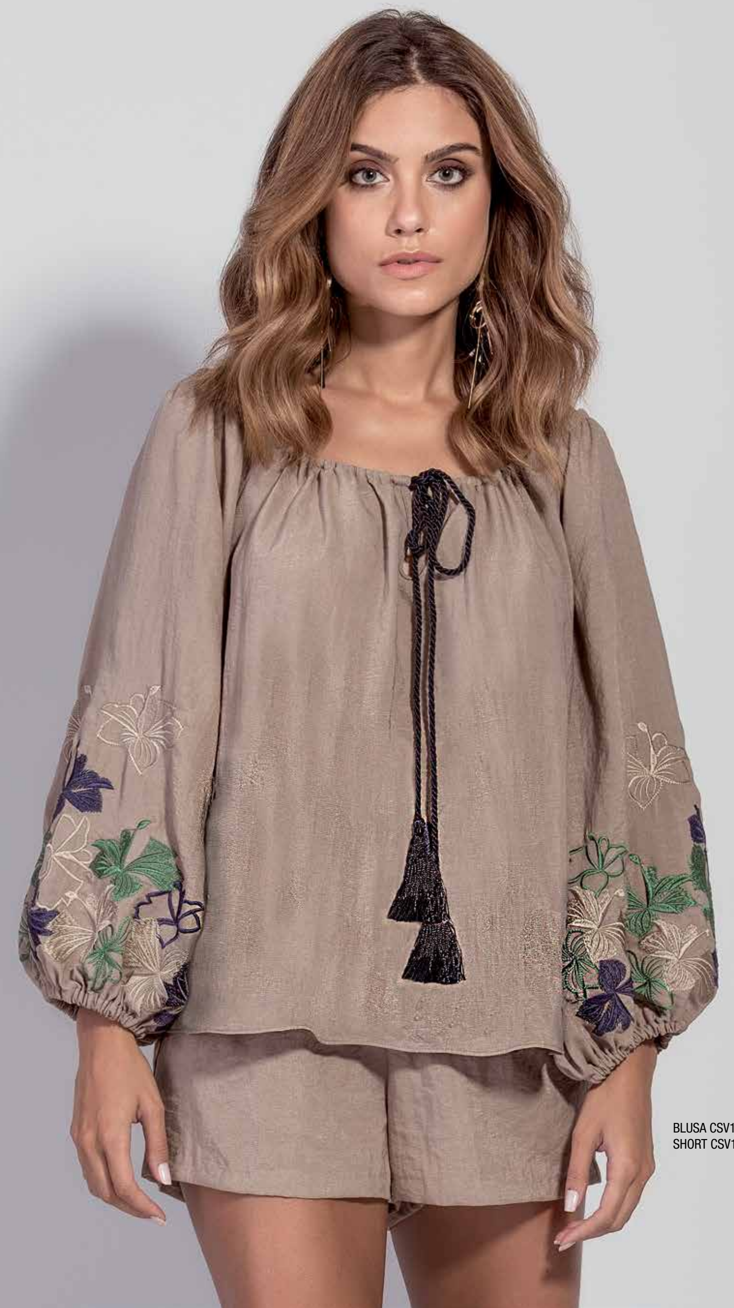
BLUSA CSV180278 SHORT CSV180279