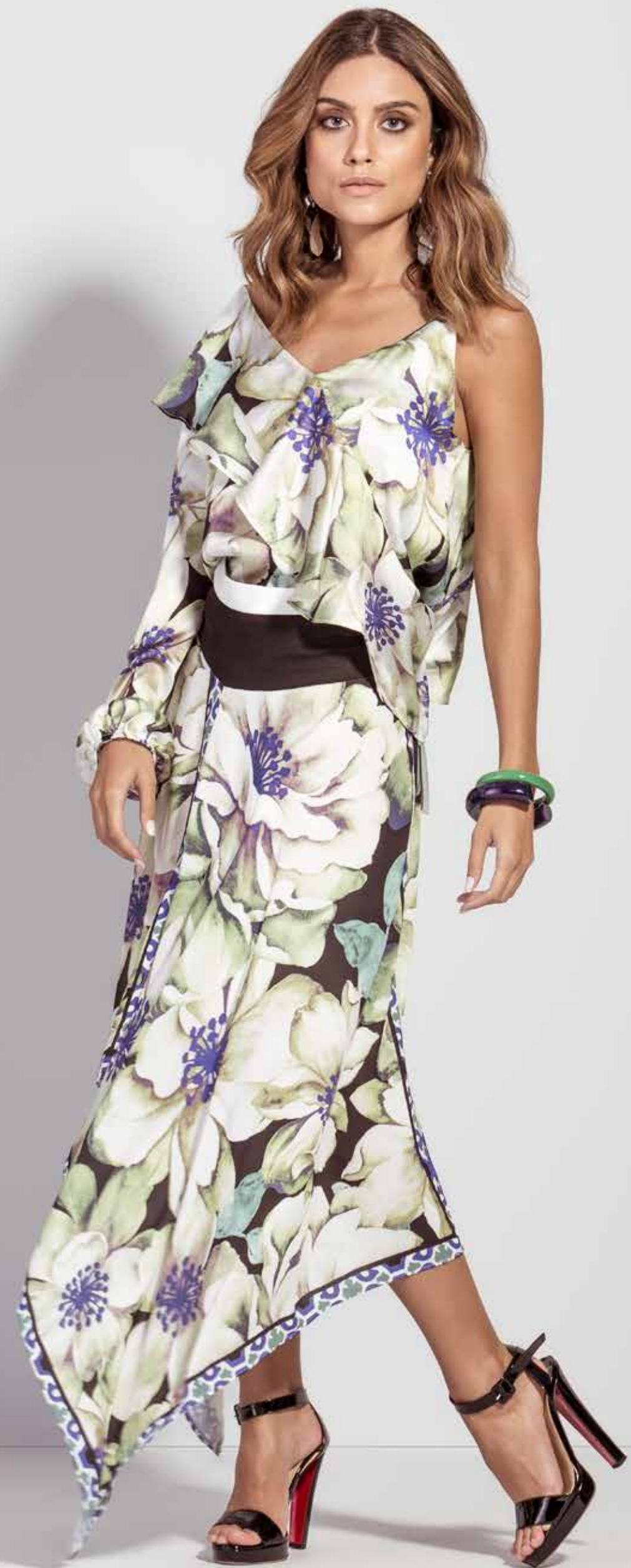
BLUSA CSV180312 SAIA CSV180310