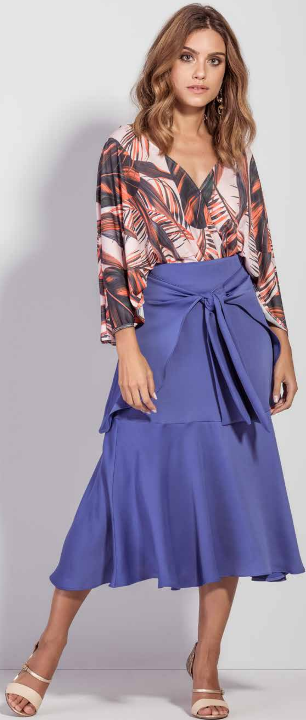
BODY CSV180191 SAIA CSV180276