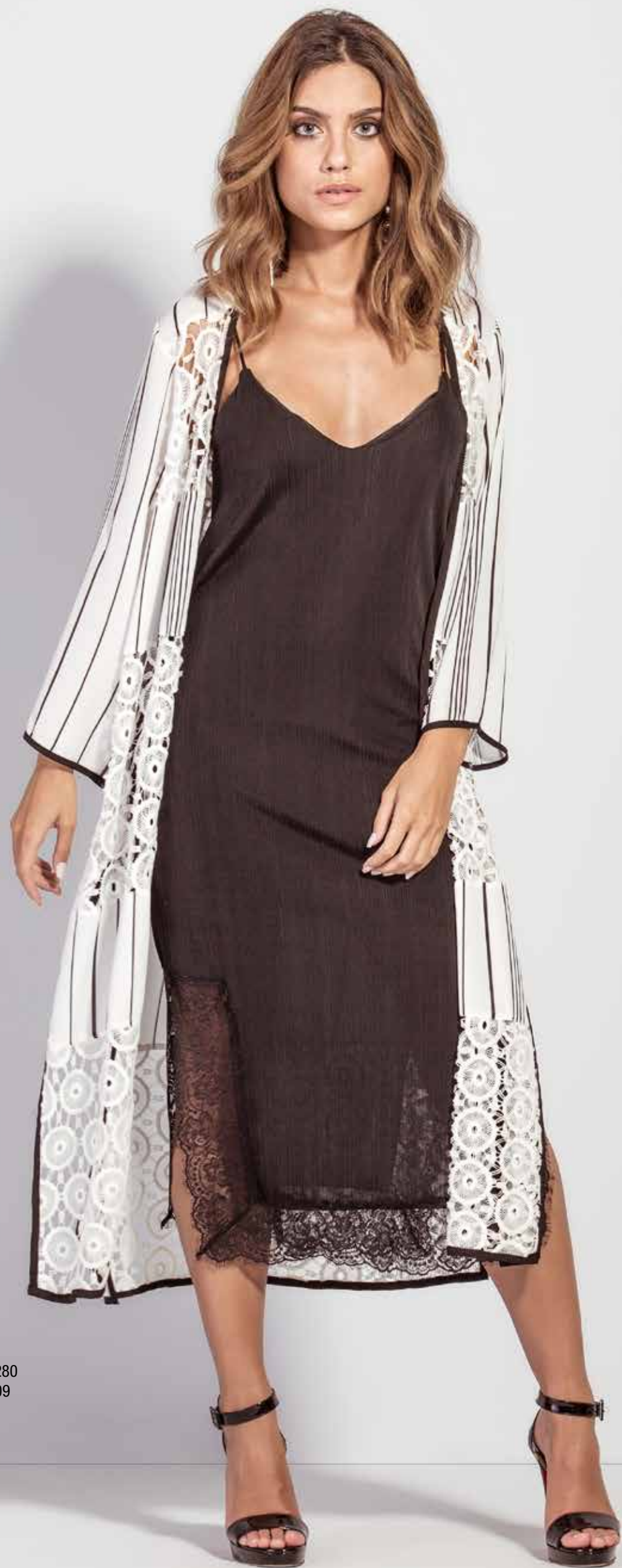
QUIMONO CSV180280 VESTIDO CSV180209