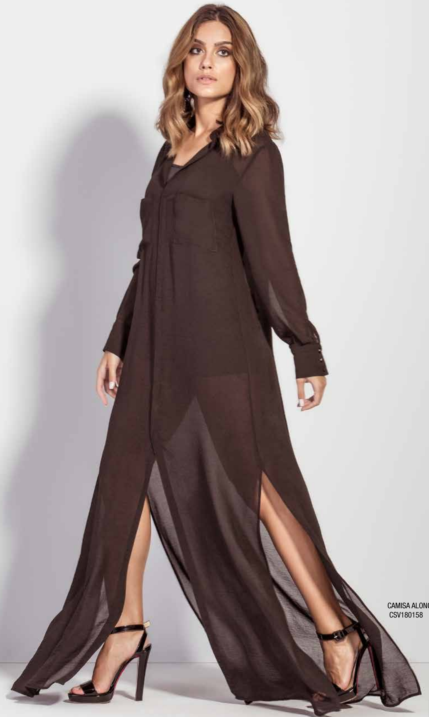
CAMISA ALONGADA CSV180158