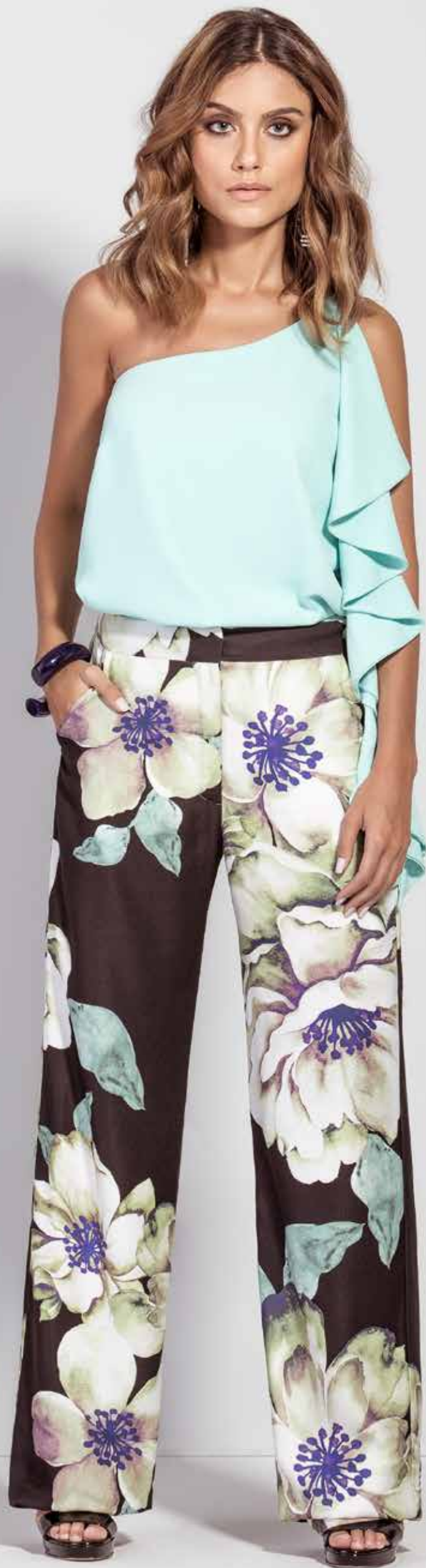
REGATA CSV180306 CALÇA CSV180304