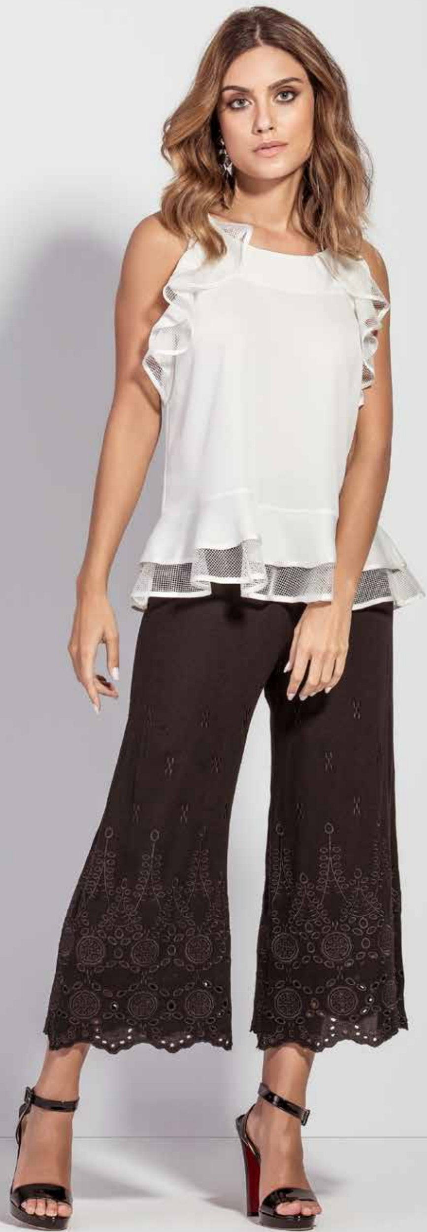
REGATA CSV180247 CALÇA CSV180221